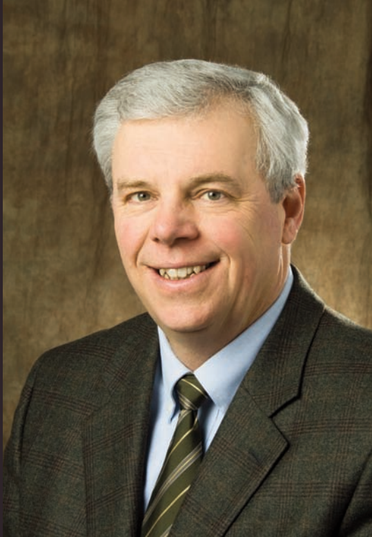
L'Honorable Greg Selinger.

L'augmentation de l'immigration francophone constitue un ingrédient essentiel en ce qui a trait au développement économique, à la réussite de nos stratégies dans le domaine du marché du travail et à la réalisation de nos objectifs démographiques, sociaux et humanitaires. À cet effet, le gouvernement du Manitoba s'est doté d'un plan de commercialisation ciblé pour augmenter l'immigration francophone au Manitoba à 7 % par année. Par ailleurs, mon gouvernement garde le cap sur son objectif global d'accueillir 20 000 immigrants par année au Manitoba d'ici 2016.